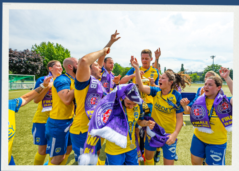
L'équipe gagnante de la 2ème édition, les hospitaliers du GHT Nord Franche-Comté aux couleurs du FC Sochaux-Montbéliard

Pour l'année 2024, la LFP renouvelle son opération pour financer cette troisième édition du Tournoi des soignants.