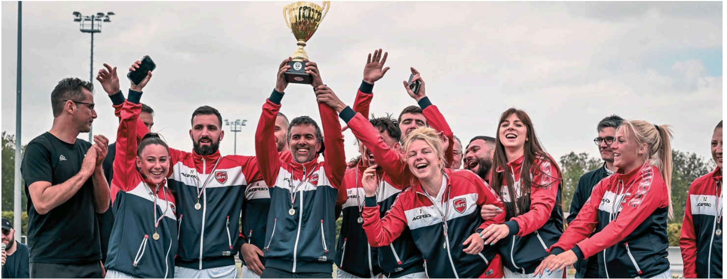
ÉQUIPE GAGNANTE DE LA 3ÈME ÉDITION, LES HOSPITALIERS DU CH DE VALENCIENNES, AUX COULEURS DU VAFC

Depuis quatre ans, la Ligue de Football Professionnel (LFP) collabore avec la Fédération Hospitalière de France (FHF) pour promouvoir les valeurs essentielles partagées par les hôpitaux et les établissements médico-sociaux publics : entraide, solidarité et esprit d'équipe. Ensemble, ils ont créé un tournoi de football unique, permettant aux hospitaliers de vivre une journée de convivialité autour d'une seule et même passion, celle du football.